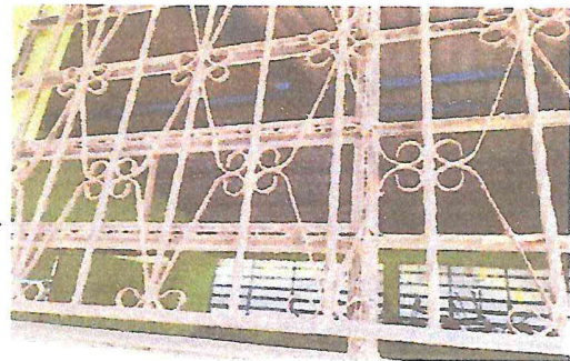
Foto 4: balcones de los módulos 10 y 11 totalmente oxidados por el salitre