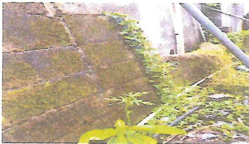
Foto 5: muro perimetral, parte de ingreso derecho parcialmente destruido