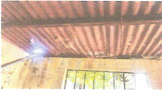
Foto 1: Parte interna de la bodega con láminas y costaneras destruidas