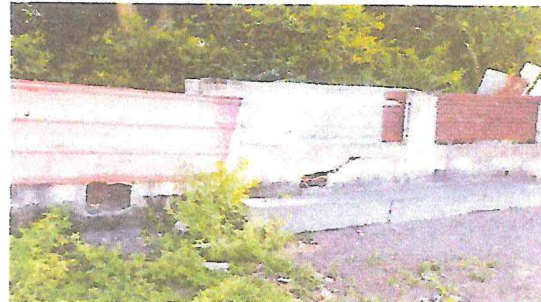
Foto 6: muro perimetral, parte trasera izquierda parcialmente destruida.

Observación: Si es necesario se pueden agregar hojas adicionales y actualizar el número de hojas.