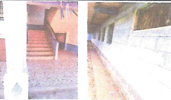
Foto 3: parte delantera y trasera de los módulos 1, 2, 3, 4, 5, 12, 13, 14 y 15 con pintura descolorida.