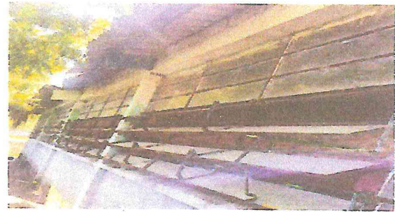
Foto 2: parte trasera de los módulos 10 y 11 con láminas destruidas